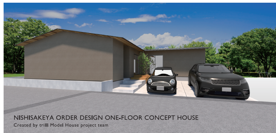
NISHISAKEYA ORDER DESIGN ONE-FLOOR CONCEPT HOUSE Created by trill Model House project team